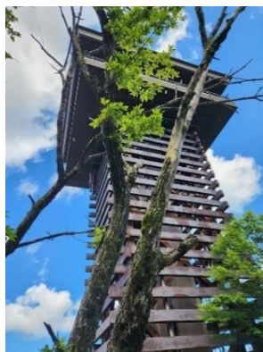
ごまさんスカイタワー